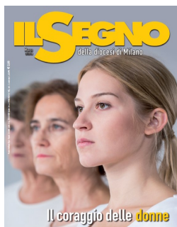
Il coraggio delle donne

Il numero di marzo de Il Segno, il mensile della Diocesi di Milano, in distribuzione agli abbonati al Banco della Buona Stampa da questa domenica , riserva ampia attenzione all'8 marzo, festa della donna a partire da un editoriale diverso dal solito, che riprende stralci dell'intervento tenuto dall'arcivescovo, monsignor Mario Delpini, in un recente incontro con le rappresentanti milanesi del Centro italiano femminile. La storia di copertina è dedicata al coraggio delle donne, sottolineando la determinazione e lo spirito di reazione con cui affrontano le avversità della vita. Tra gli altri argomenti, gli aggiornamenti sul percorso sinodale proposto alla nostra diocesi.