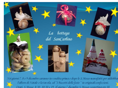
Nei giorni 7, 8 e 9 dicembre saranno in vendita prima e dopo le S. Messe manufatti per addobbare l'altare di Natale e la tavola, ed "I buccotti delle feste" in originali confezioni. Orari S. Messe: 8.30, 10.30 e 19. Il giorno 7 dicembre S. Messa vespertina ore 18.

In occasione di una cena, un giovane amico ha formulato un'interessante obiezione: "Ci sono, è vero, dei rischi a fissarsi solo sul lavoro. Se però Dio mi ha dato