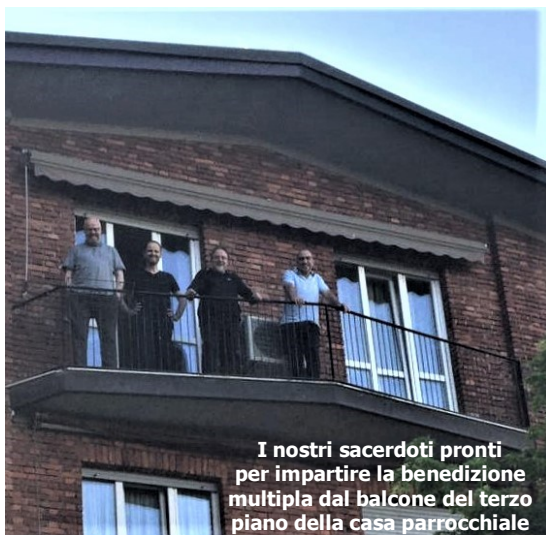
I nostri sacerdoti pronti per impartire la benedizione multipla dal balcone del terzo piano della casa parrocchiale

«Avevamo immaginato un'altra Pasqua»: con queste parole si apre il "messaggio di speranza" che l'Arcivescovo mons. Mario Delpini invia alla Diocesi per questo tempo pasquale, vissuto in maniera del tutto singolare. Questo nuovo testo si affianca alla sezione della Proposta pastorale per il 2019-2020 (La situazione è occasione): "Siate sempre lieti nel Signore" (Fil 4,4), lettera per il tempo di Pasqua", fornendo alcuni spunti per rileggere in modo più puntuale e diretto il periodo affaticato che stiamo vivendo. «La morte è diventata vicina, interessa le persone che mi sono care» cosa che – nota l'Arcivescovo – normalmente non è per noi usuale, all'interno delle quotidiane preoccupazioni. Il pensiero va a coloro che vengono ricoverati, alle loro famiglie e a quelli che passano dalla vita terrena alla vita eterna a causa di questa pandemia. «La morte è così vicina e non ci pensavamo» e tutto questo «suscita domande che sono più ferite che questioni da discutere». (Il testo è disponibile sul sito della diocesi e anche sul sito della parrocchia)