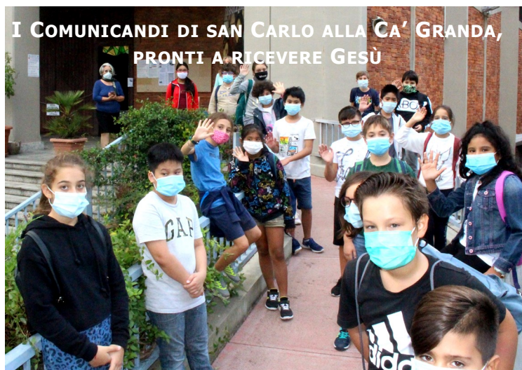
I COMUNICANDI DI SAN CARLO ALLA CA' GRANDA, PRONTI A RICEVERE GESÙ

e... Sabato 17 e Domenica 18 Ottobre alle ore 16.00, S. Messe di Prima Comunione